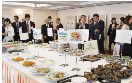
←過去のパーティー会場の様子 (受賞作品も含む)